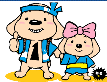
積丹町健康づくりキャラクター ソーランわんぽくん / ソーランわんこちゃん