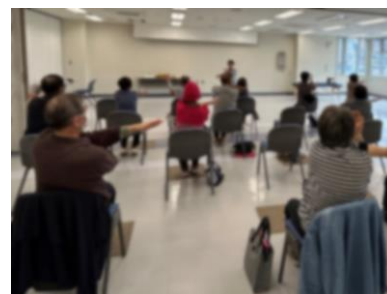
いきいきクラブ(介護予防教室)

町内全戸に設置のIP告知端末機を活用し、町の健康課題に関する情報の発信、普及啓発を実施する。また、健診会場や通いの場において、介護やフレイル予防に関する健康教育・健康相談を実施するとともに、リーフレット配布やポスター掲示を行う。経過観察や継続支援が必要と判断した場合は、医療専門職(保健師・管理栄養士)による保健(栄養)指導を実施する。必要に応じて医療機関への受診勧奨や地域包括支援センターへの接続を行う。