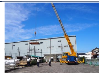
↑10月には玉掛合図訓練を行います。