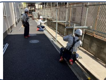
↑単管パイプの組立等、基礎からしっかりと教えます。