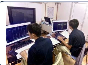
↑学科設備も整っています。