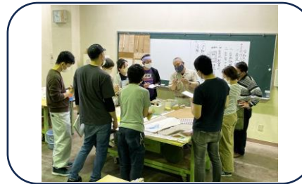
↑ 掛軸製作実習 材料について解説