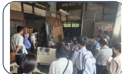
↑ 年に1回研修旅行を実施