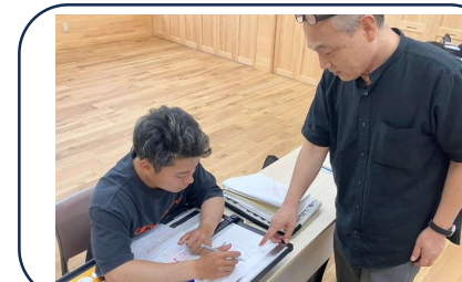
↑ 建築製図の授業風景