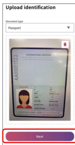
パスポートの情報をアップロード