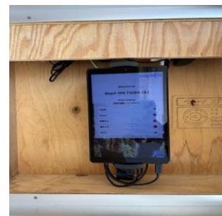
チェックイン用の タブレット