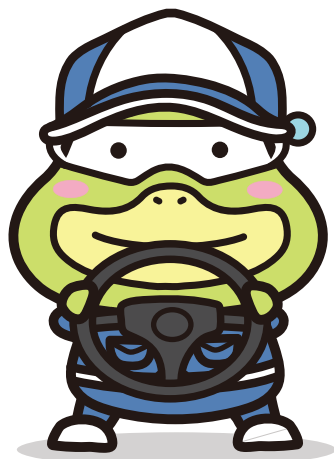
労働基準局広報キャラクター たしかめたん