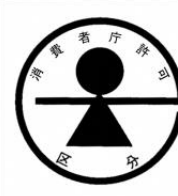
542 (b) 特別用途食品の標識

543 以上に述べた(a) 保健機能食品、(a) ① 特定保健用食品、(a) ② 栄養機能食品、(a) ③ 機能 544 性表示食品、(b) 特別用途食品（特定保健用食品を除く。）の規制上の関係を図示すると次表 545 のとおりとなる。