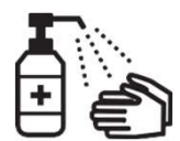
Спиртэн суурьтай гар халдваргүйжүүлэгчээр гараа ариутгах

Хэрэв та вэбсайт үзэх боломжгүй бол оршин суугаа хотын захиргаа руу хандана уу.