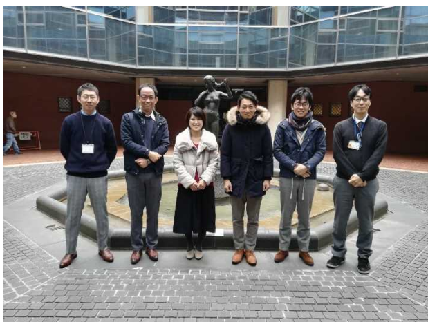
（両センター支援員と市担当職員のみなさん）

昨年7月の豪雨では各地で浸水や土砂崩れが発生し、その被害は本市がこれまでに経験したことが無い規模となりました。特に甚大な浸水被害が生じた真備地区の様子は報道等でご覧になられた方も多いのではないのでしょうか。災害発生後には、全国から、義援金をはじめ、物資の寄附や職員の方の派遣など多大なご支援・ご協力をいただきました。この場をお借りして改めてお礼申し上げます。