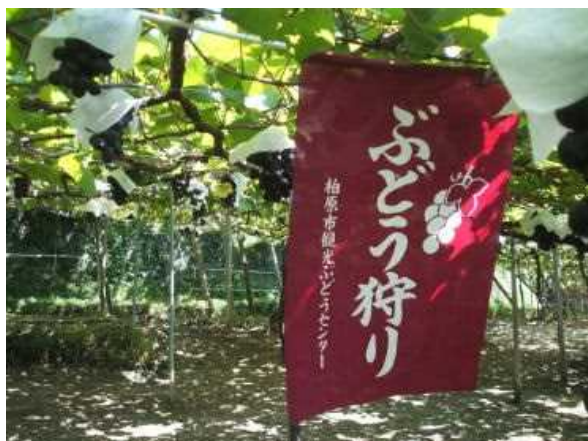
(柏原市名物ぶどう狩り)

柏原市は、大阪平野の南東部、大阪府と奈良県の府県境に位置しています。市域の3分の2を山が占め、大阪の都心からわずか20kmほどの距離にありながら、豊かな自然に囲まれたとても暮らしやすい市です。総面積は25.33平方キロメートルで、人口は約7万人です。ブドウ畑が多く、柏原地ワインが有名です。市内中央部を東西に一級河川の大和川が流れ、柏原市を起点として、江戸時代に大和川の付け替え工事が行われたことでも知られています。