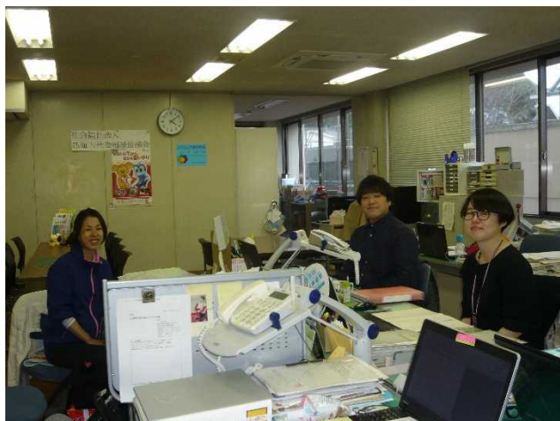
(熱海市自立相談支援窓口のみなさん)

ず、毎食弁当で過ごしていた方などに炊飯器やガス調理器を提供することで、月6万円の食費だったところが月4万まで下がるなど食費の削減なども図られています。