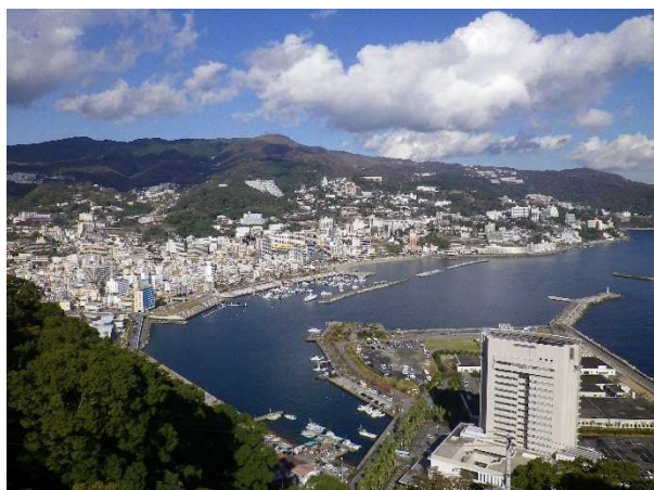
(風光明媚な熱海市内の全景)

生活困窮者自立支援事業の平成29年度状況は、新規相談受付件数が173件となっており、うち50代から60代の相談が多くみられています。