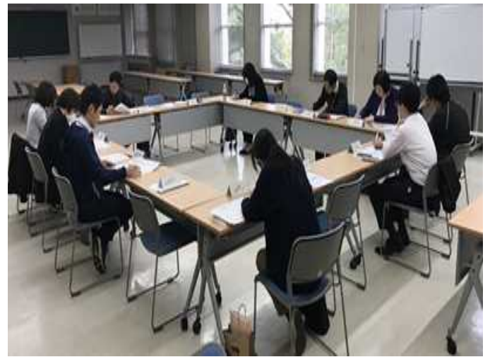
(倉敷市支援調整会議の様子)

今回の改正生活困窮者自立支援法により、「支援会議」という新たな会議体を設置することが可能となりました。