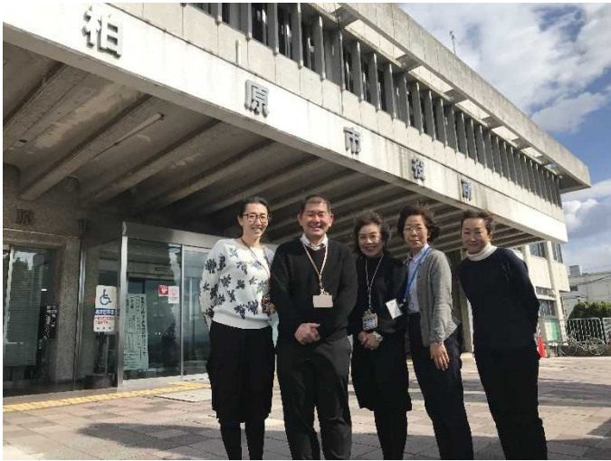
(柏原市のみなさん)