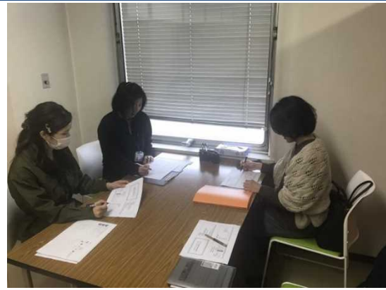
(両センターの支援員勉強会の様子)

このように、社会資源を単に「知っている」だけでなく、「活用できる」状態にして共有することを常に意識しています。