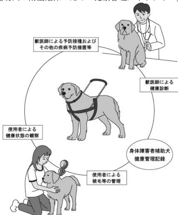
図1 「身体障害者補助犬の衛生確保のための健康管理ガイドライン」の概念

以上のガイドラインの概略について、「図1「身体障害者補助犬の衛生確保のための健康管理ガイドライン」の概念」に要約して示した。