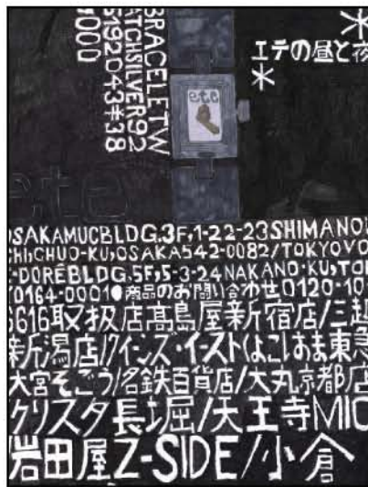
武田 英治(たけだ えいじ)

タイトル:時計 2004年制作 542×382mm 紙に鉛筆・修正液・ペン 所蔵:アトリエ インカーブ