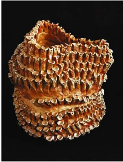
西川 智之(にしかわ さとし)

タイトル:うさぎの花瓶 1993年制作 270(H)×275(W)×269(D)mm 陶土・自然釉 収蔵:滋賀県立近江学園