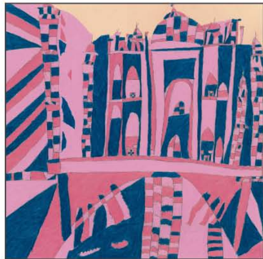
湯元 光男(ゆもと みつお)

タイトル:鉄骨部材 2003年制作 180×180mm エッチング 限定30 所蔵:アトリエ インカーブ