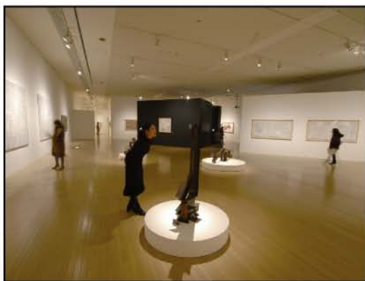
サントリーミュージアム[天保山]での 「現代美術の超新星たち アトリエ インカーブ展」

タイトル:宮でん 2004年制作 364×364mm イラストボードに色鉛筆 所蔵:アトリエ インカーブ