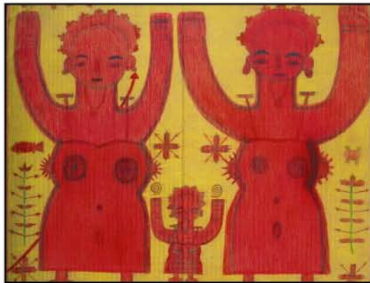
小幡 正雄(おばた まさお)

タイトル:電車 1995年制作 362×257mm 鉛筆・色鉛筆・紙 収蔵:作家蔵