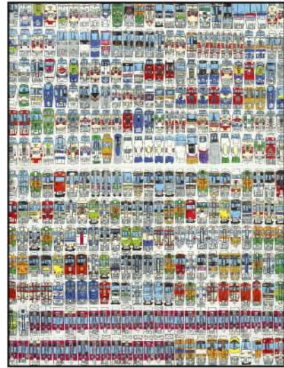
本岡 秀則(もとおか ひでのり)

タイトル:美しいお姉さん 2000年制作 543×384mm 鉛筆・色鉛筆・紙 収蔵:社会福祉法人オーブンスペースレガートワーク・アイセンターパンパンアトリエ