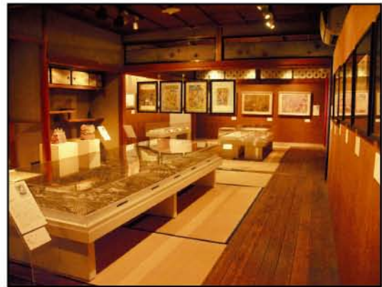
ポータレス・アートミュージアムNO-MA 「アールブリュット/魂の交差」展 展示風景

無題 制作年不詳 606×693mm 鉛筆・色鉛筆・段ボール 撮影:大西暢夫 収蔵:NPO法人はれたりくもったり