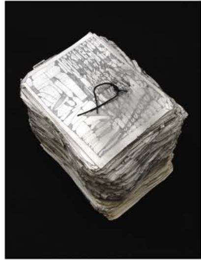
戸來 貴規(へらい たかのり)

タイトル:うさぎの花瓶 1993年制作 270(H)×275(W)×269(D)mm 陶土・自然釉 収蔵:滋賀県立近江学園