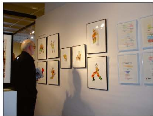
ニューヨークのアート・フェアに アトリエ インカーブのアーティストの作品が出品