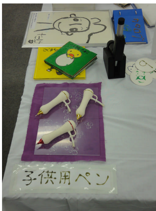
子供用触図筆ペン最終モデルの展示