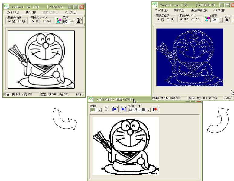
図3 点図作成ソフト