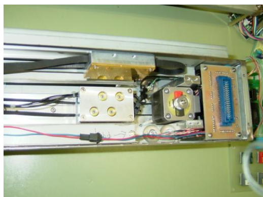
図1 試作機 印字ヘッド部分