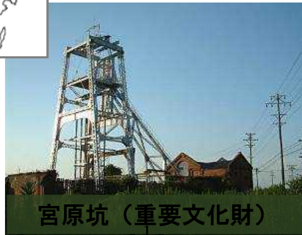
宮原坑 (重要文化財)

平成25年9月、今年度の世界文化遺産政府推薦案件が、「明治日本の産業革命遺産 九州・山口と関連地域」に正式に決定！！