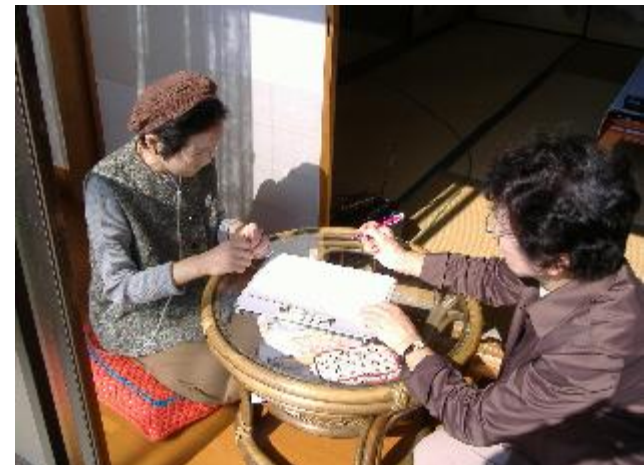
民生委員による生活調査