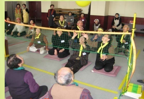
地域ふれあいサロン