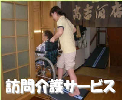
訪問介護サービス