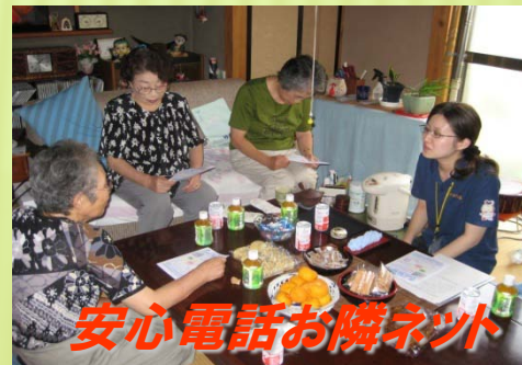
安心電話お隣ネット