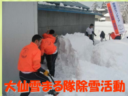
大仙雪まる隊除雪活動