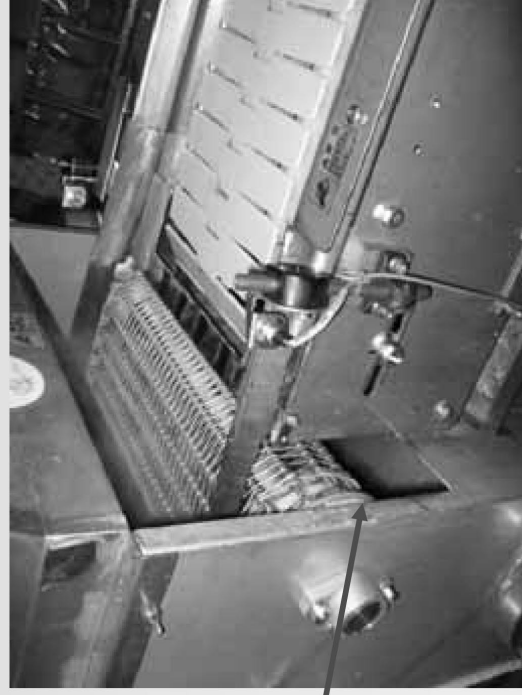
ネットコンベア入口 出口