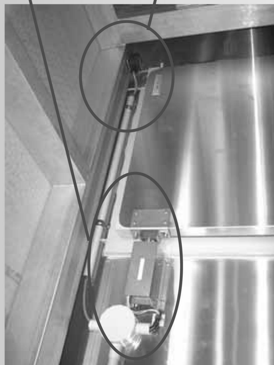
ドア開による火傷対策