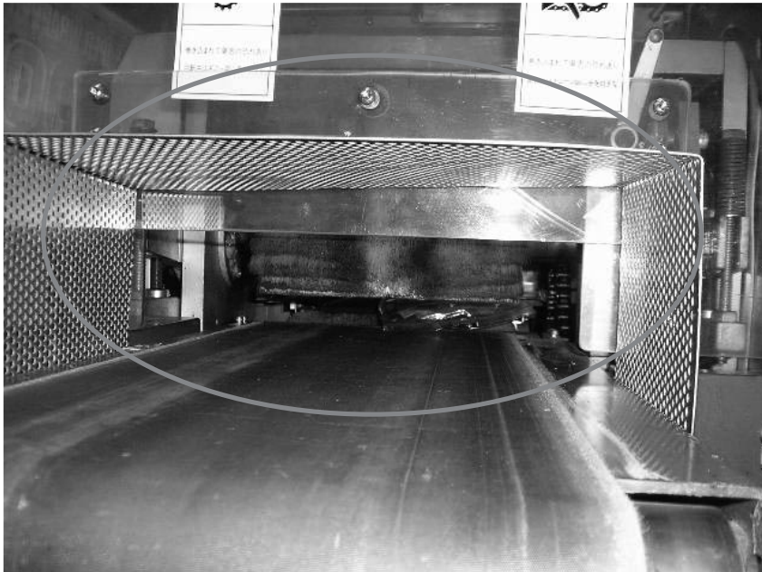
図1はんぺん包装機改善例（改善後）