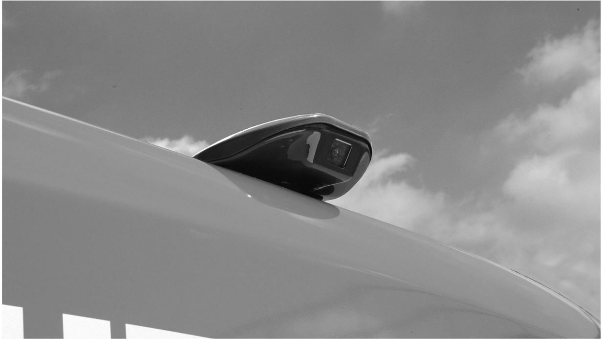
図 3 オペレータ支援モニターカメラ