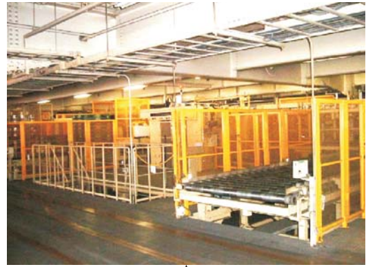
積付けパレット搬出口