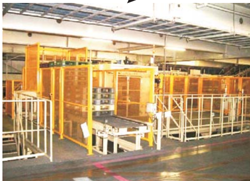
空パレット供給口