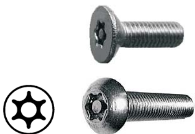
参考：トルクスネジ