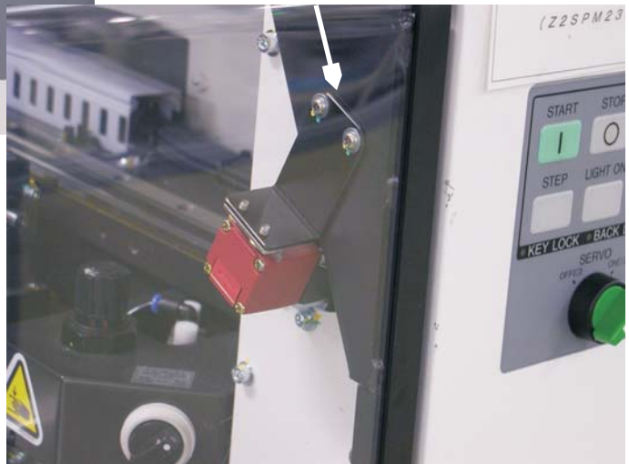
⑧アクチュエータの固定ボルト