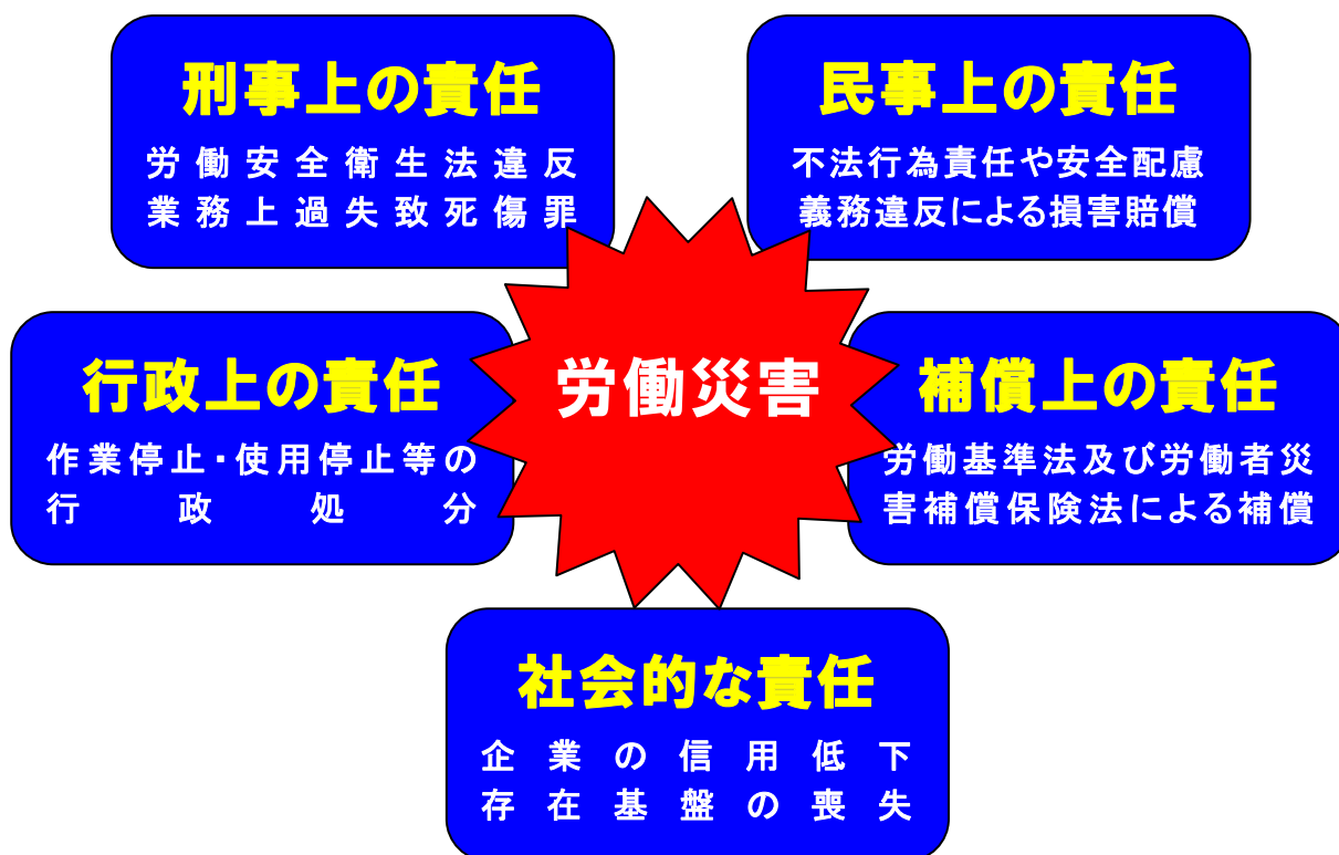
図1-12 労働災害の発生と企業の責任

企業は、事業活動目的に従い従業員を雇用し、これを組織・管理してその目的に沿って統合して運営する法的な存在です。もし、みなさんの企業に死亡災害等が発生した場合には、企業としてどのような責任が発生するのでしょうか。次の図1-12を元にして説明します。