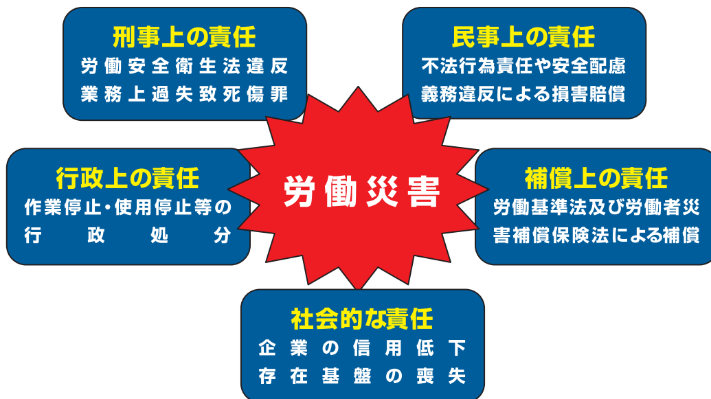
図8 労働災害に問われる企業の責任