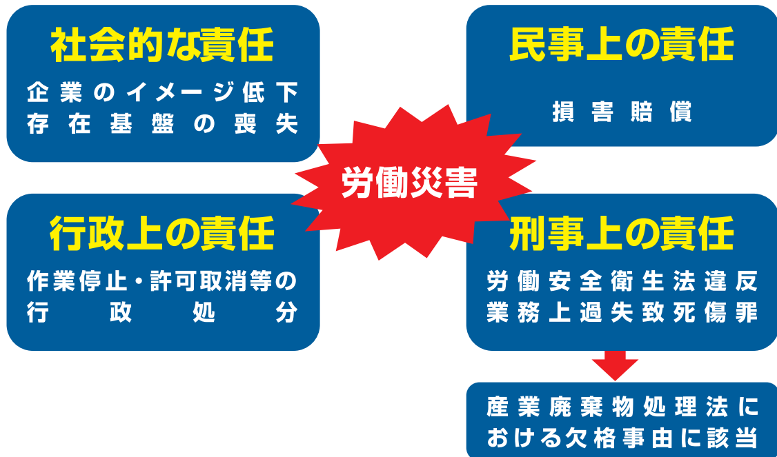
図8 労働災害に問われる企業の責任