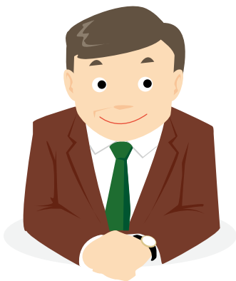
株式会社明神館 代表取締役

これからの旅館業は、さらに進化し、変わっていくでしょう。そのような中で、従業員一人ひとりが明確なキャリアイメージとともに新たな仕事にチャレンジする意欲を持って働くことは大変重要であると考えています。自社版のキャリアマップを作成し、職業能力評価シートを活用した能力チェックを行うことで、従業員によい刺激を与えられるだけでなく、人材育成の方法を検討するための視点を得ることができます。当社でも、能力チェックの結果を参考に、人材育成の取り組みをさらに充実させていきたいと考えています。