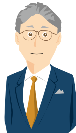
株式会社ホテル佐勤 代表取締役社長

職業能力評価シート・キャリアマップといったツールは、従業員にキャリア形成の過程を示し、スキルアップ・キャリアアップ目標と成長実感を持ちながら業務に従事してもらうために、非常に有益だと思います。旅館業には様々な形態がありますが、職業能力評価シートのよいところは、旅館ごとの業務内容や職制に合わせたカスタマイズがしやすいところです。当社でも、職業能力評価シートの内容を参考に、自社の人事評価基準や人材育成の体系をブラッシュアップしていきたいと考えています。