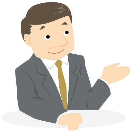
ビルメンテナンス企業 人事部長

このマニュアルは、「企業の発展に繋がる人材育成」をお考えの方に向けて作成されたものです。—企業は人なり—と言われるように、社員のスキルは企業の最大の資産であり、成長の源泉でもあります。社員のスキルをより一層強化していきたいとお考えの方、自社の人材育成施策やツールを見直したいとお考えの方は、是非このマニュアルを参考にし、活用して下さい。