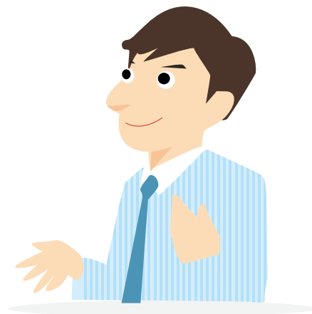
ビルメンテナンス企業 設備管理担当者

「職業能力評価シート」の各項目について自己チェックしたことで、自分自身の知識や実力の現状を認識でき、今後どうすべきかを改めて見直すことができました。定期的なチェックを通じて、自身のスキルアップに取り組んでいきたいと思っています。