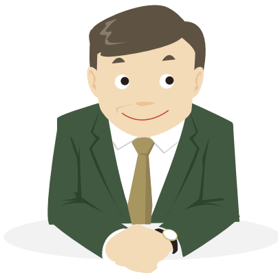
ホテルニューグランド 支配人

職業能力評価シートの最もよいところは、求められる業務レベルが明文化されていることだと思います。特にマネジメントスキルについては理解が曖昧な部分があり、ツールを使ってチェックすることで自分の弱点がとてもクリアになりました。今後は明らかになった弱点を一つ一つ克服したいと思います。