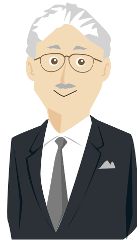
芝パークホテル 支配人

職業能力評価シート・キャリアマップといったツールを使うことによって、手間をかけることなく部下に必要なスキルを網羅的に提示できました。これにより、部下のスキルアップ意識を刺激することができたことは大変良かったと思います。これらのツールは大変コストパフォーマンスに優れていると思います。