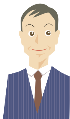
株式会社福祉の街 取締役

このマニュアルは、「法人の発展に繋がる人材育成」をお考えの方に向けて作成されたものです。－企業は人なり－と言われるように、職員のスキルは法人の最大の資産であり、成長の源泉でもあります。職員のスキルをより一層強化していきたいとお考えの方、自法人の人材育成施策やツールを見直したいとお考えの方は、是非このマニュアルを参考にして、活用して下さい。