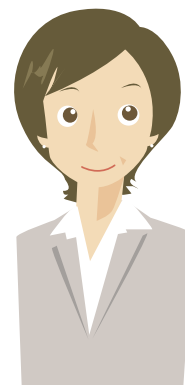
株式会社ナイスケア 訪問介護事業部統括責任者

また、部下の評価を厳しく付けてしまったのでは、と悩む場面もありましたが、評価後に面接を行いフィードバックをする際には改善点をお互いに確認し合えるので話が伝えやすくポジティブな雰囲気が進められ、具体的な目標なども設定しやすくなったのはよい点でした。自己や職員のスキルチェックに今後も活用していきたいと思います。