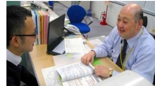
担当者制による個別支援の実施 (わかものハローワーク)

初めは県内で探したが、自分に合うものが無かった。 全国の求人から職員の方に一緒に探してもらい、希望の仕事が見つかり良かった。 ジョブクラブに参加し、一緒に就職活動を進める友達がいて心強い。互いに励ましあい息抜きしながら頑張ることができた。