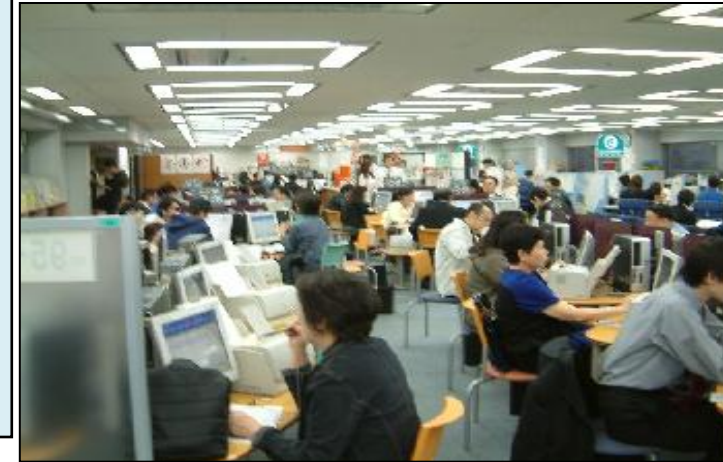
<ハローワークでの求職活動の様子>