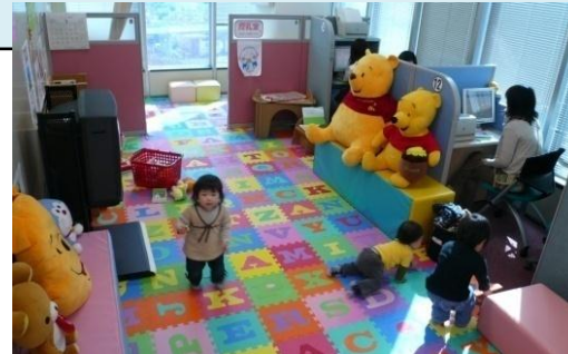
求人情報検索機の隣のキッズコーナー (マザーズハローワーク)

40代の母子家庭の母。職業相談を重ね、これまでの応募不調の原因を探り、応募書類や面接対応についての見直しなどを助言。利用から2か月後、正社員として採用が決定。母子寮を退所し、会社近くで親子3人で新たな生活を開始。