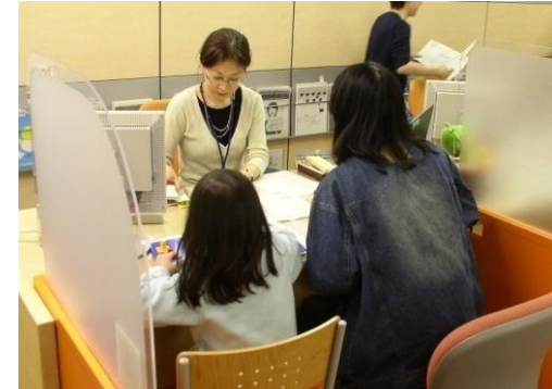
子ども連れでの職業相談の様子 (マザーズハローワーク)