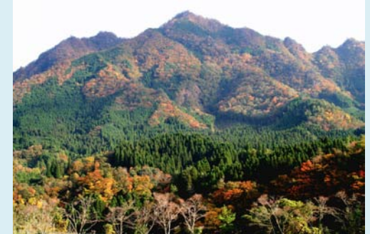
九州島発祥の地「祇園山」