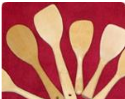
宮島の杓子「みやじまさん」

杓子を始めとして、彫刻、ロクロ、刳物などの木製品を制作する「宮島細工」の伝統工芸士が各2名となり、技術の断絶が危惧されている。