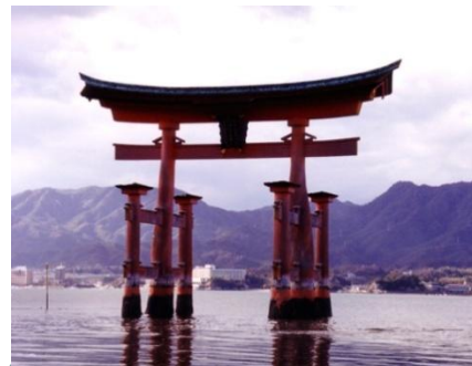
厳島神社の大鳥居

古くから宮島にある伝統工芸「宮島細工」を活用した、新しい土産物の開発、宣伝、販路開拓を行い、新しい宮島ブランドを作ることで、伝統産業の後継者育成、宮島観光の振興に繋げる。