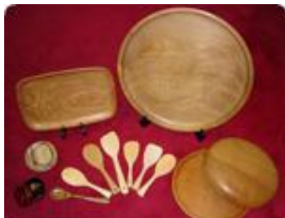
ロクロ細工 宮島彫り 杓子

宮島への観光客はH20で343万人と急増しているが、島内で製作された土産物品は少なく、一人当たりの観光消費額が増加していない。