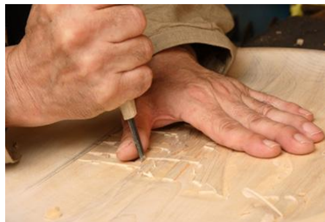
宮島彫り 木肌にノミの刃を当てている様子