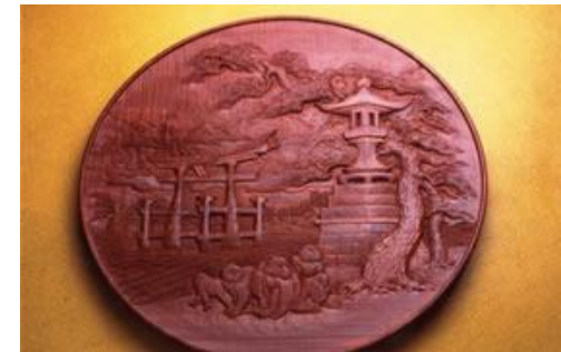
素地を活かした、繊細で写実的な装飾彫刻が特徴