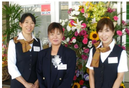
情報部、営業部、総務部