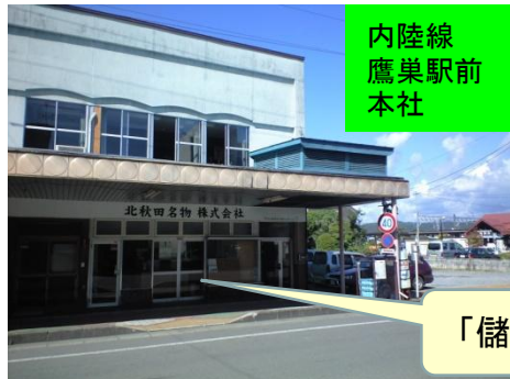
内陸線 鷹巣駅前 本社

この会社が3年後、立派に機能し、私たちが幼少の頃の活気をこの北秋田市に取り戻す事が最大の目標です。