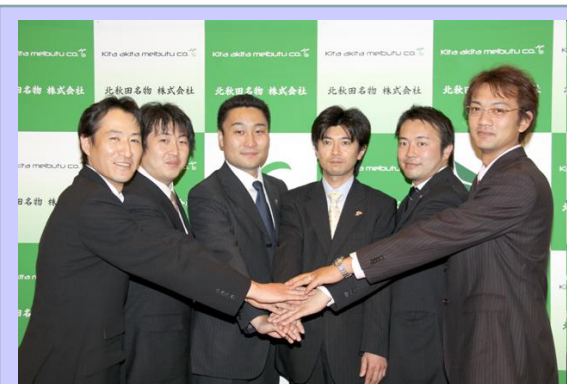
《北秋田名物株式会社を創業した6人》