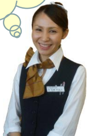
観光コンシェルジュ