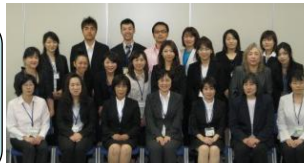
学童保育支援センタースタッフ

オープニングフェスタでは支援員全員が放課後児童クラブの充実と発展を目指して活動する決意表明を行いました。