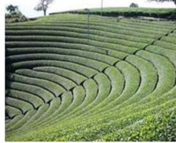
町内で栽培される宇治茶の茶畑