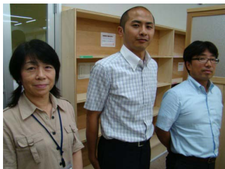
講習スタッフのみなさん