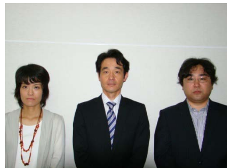
教材作成スタッフのみなさん

障がい者向け講習は、障がい者に対する特段の配慮、コミュニケーション技術育成、精神的成長の喚起等、高い専門性を要するため、講師陣・受講生側にとっても「やさしい」教材が必要とされています。