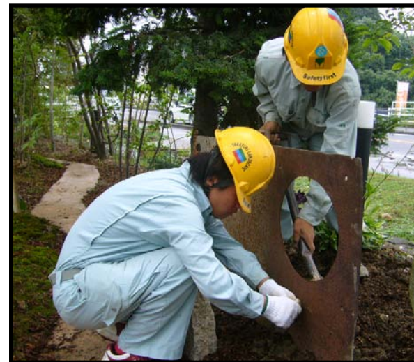
古材を利用したオブジェ設置仕上げ作業