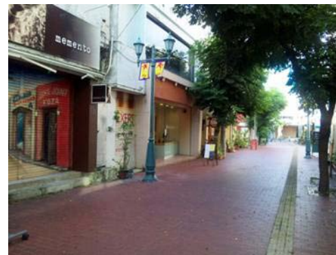
《パルミラ通りと店舗》

いくつかの企画した 取り組みがメンバーと共に 実現している事に手応えを 感じます。