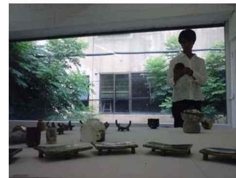
《「ギャラリーM&A」旧ラファイエット》

創作活動がビジネスとして確立し、沖縄市の新たな産業として 県外、海外へと展開していくことを期待しています。