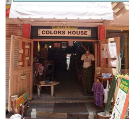
《クリエイターのシェアショップ「カラーズハウス」》

沖縄県完全失業率 6.6% 沖縄県有効求人倍率 0.26倍 ハローワーク沖縄管内 0.20倍