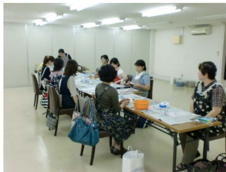
【当店主催の講習会風景】