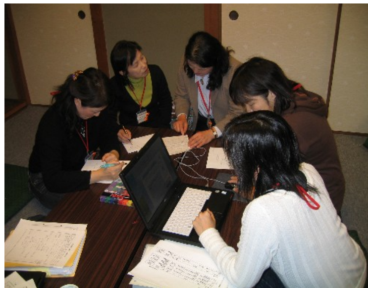
(チーム活動の様子)

などの地域で、身近な地域できめ細かな家庭教育支援を行うため、子育て情報誌の発行や子育て相談の実施、子育てサロン等へ出向いたPRや気軽な相談、家庭教育に関する学習機会の企画・運営などに取り組みられています。