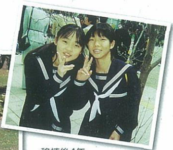
移植後4年 中学校に入学しました!