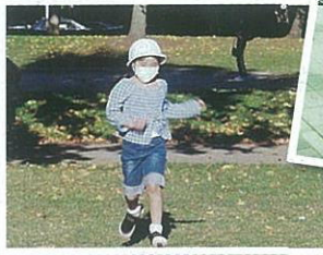
移植後2ヶ月 走ったりできるほど元気に回復