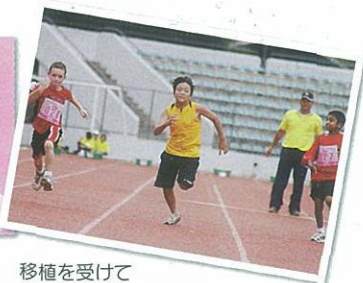
移植を受けて 元気に走る子どもたち