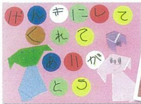
心臓移植を受けた 女の子のサンクスレター

移植を受けた患者さんは、ドナーのご家族に絵や手紙などで感謝の気持ちを表現し、移植コーディネーターを介し、実名を出さずやり取りすることができます。