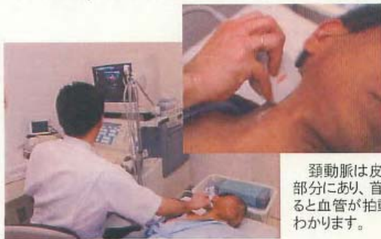
頸動脈は皮膚の下の浅い部分にあり、首の左右を触れると血管が拍動しているのがわかります。