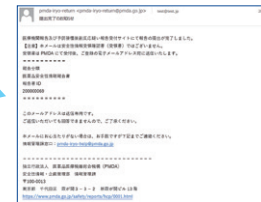
※実際の画面とは異なる場合があります

皆さまからの報告を起点に、厚生労働省、PMDA、製造販売業者など、医療にかかわる人たちが報告情報を活用することで、日本の医療を支えています。