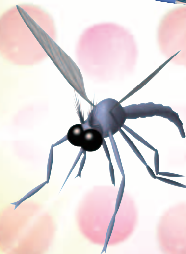
WEST NILE FEVER