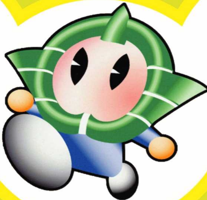
香芝市マスコットキャラクター カシー