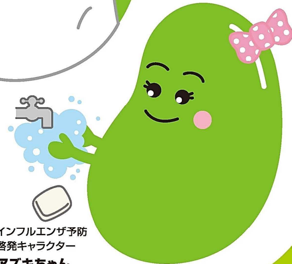
インフルエンザ予防 啓発キャラクター アズキちゃん