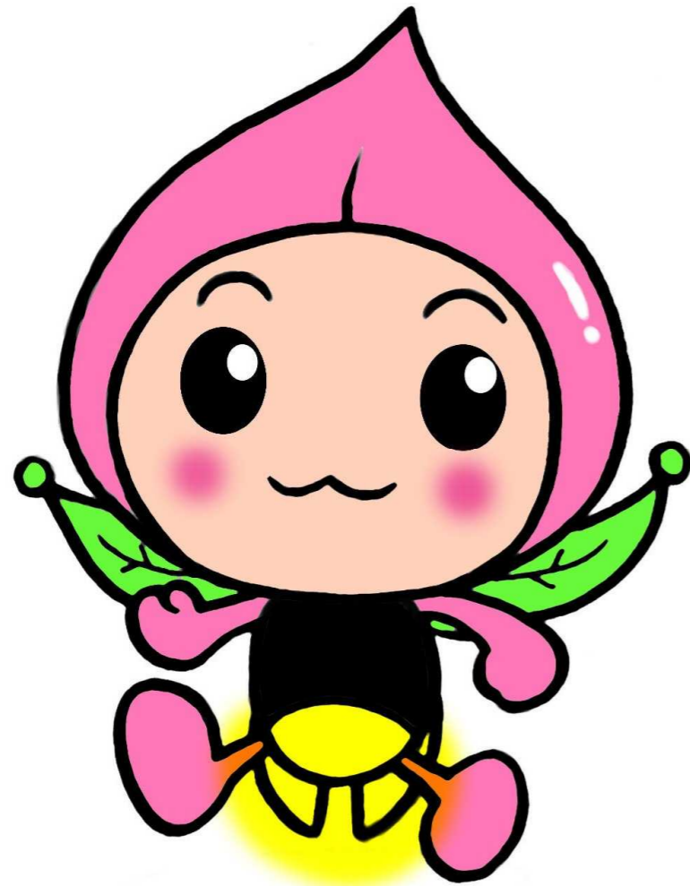
桑折町観光大使 ホタピー