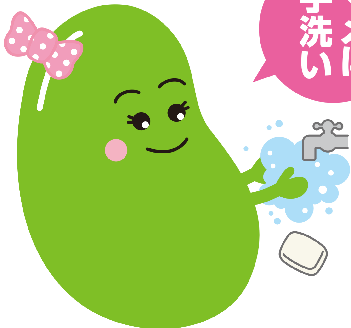
インフルエンザ予防啓発キャラクター アズキちゃん