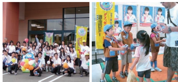
街頭キャンペーン

本冊子は、グリーン購入法の基準を満たす紙を使用しています。 リサイクル適性の表示：紙へのリサイクル可