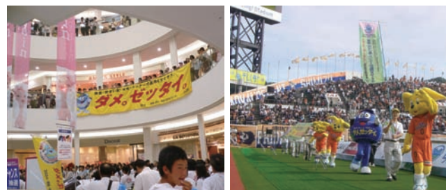
街頭キャンペーン

薬物乱用は「ダメ。ゼッタイ。」を合言葉に、募金活動へのご協力をお願いいたします。