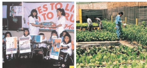
支援プロジェクト(中米・グアテマラ)