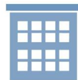
年金事務所・ 市区町村の年金窓口