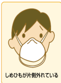
しめひもが片側外れている