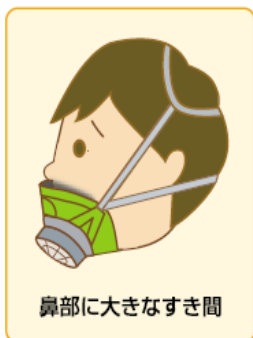
鼻部に大きなすき間