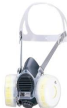
取替え式防じんマスク