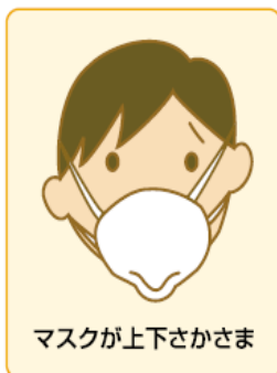
マスクが上下さかさま