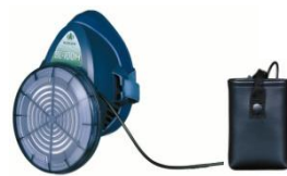
電動ファン付き呼吸用保護具