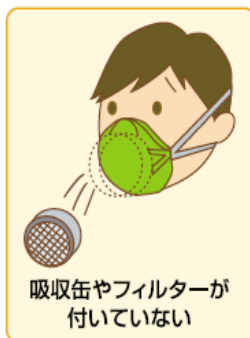
吸収缶やフィルターが 付いていない