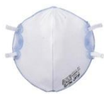
使い捨て式防じんマスク

がれきの粉じんには石綿が含まれているおそれがあります。事業者の指示に従い、適切なマスクの着用をお願いいたします。